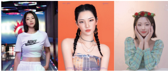
출처: 왼쪽부터 리나 인스타그램(@rina.8k), 로지 인스타그램(@rozy.gram), 한유아 인스타그램(@_hanyua)

정답은 바로 버추얼 인플루언서(Virtual Influencer), 즉 디지털 휴먼(Digital Human)이기 때문이다.