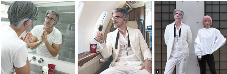
그림 5 KFC 공식 인스타그램에서 공개한 커널 샌더스

2019년 KFC는 창업주이자 브랜드 마스코트인 커널 샌더스를 컴퓨터 생성 이미지(CGI)로 재창조했다. KFC는 새로운 커널 샌더스의 모습을 인스타그램에 게시하고 ‘secret recipe for success(성공을 위한 비밀 레시피)’ 라는 해시태그를 삽입하여, 성공한 사업가의 모습으로 커널 샌더스를 재탄생시켰다. 젊고 잘생긴 미모로 재창조하여 Z세대의 취향을 저격했으며, 이 캠페인은 KFC SNS 계정의 팔로워를 약 100만 명까지 상승하는 데 기여했다.