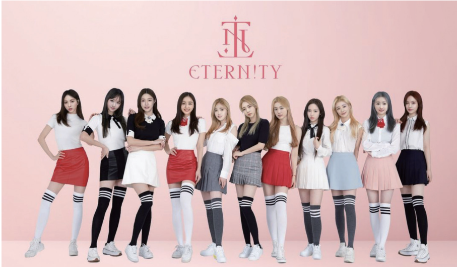
그림 10 펠스나인에서 선보인 걸그룹, 이터니티