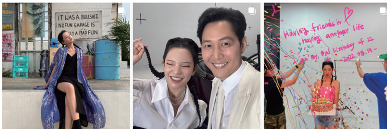
그림 4 국내 최초의 버추얼 인플루언서, 로지

2020년 7월 보험회사인 신한라이브 광고로 데뷔했고, 22살의 나이로 설정되어 평생 22살에 머무르며 활동을 이어갈 로지는 모델, 배우, 가수로 열성 팬을 모으고 있다. 2021년 2월 22일 ‘후 엠 아이(Who am I)’라는 노래를 내놓은 데에 이어, 2021년 11월 발표한 뮤직비디오는 공개 3주 만에 1,000만 조회수를 기록하며 지속적인 화제성을 보여주었다. 광고 모델뿐만 아니라 티빙 오리지널 드라마 <내과 박원장>에 카메오로 출연해 연기자로서의 가능성을 보여주었고 넷플릭스 ‘오징어 게임’으로 세계에 이름을 알린 이정재와 함께 ‘2030 부산세계박람회’ 홍보대사로 발탁되는 등 다양한 행보를 보이고 있다.