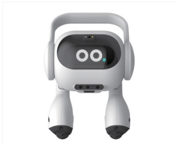
그림 3 LG전자, 스마트홈 AI 에이전트