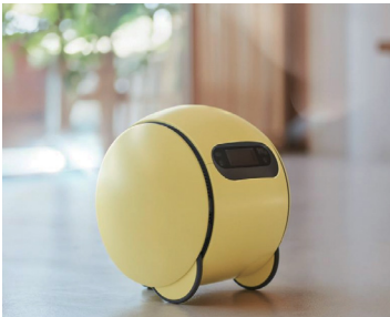
그림 2 삼성전자, 볼리(Ballie)

미국의 로봇 개발 기업 Ogmen 로보틱스도 반려 동물 돌봄에 특화된 AI 로봇을 선보였다. ‘오로(Oro)’라는 반려견 컴패니언은 양방향 오디오 및 비디오 기능을 통해 사람이 집을 비운 동안에도 반려견을 계속 주시하고 소통할 수 있을 뿐만 아니라, 함께 놀아주고 간식을 먹여주며 반려견의 불안한 징후를 알아차릴 수 있도록 학습하는 기능을 가지고 있으며 799달러에 출시할 계획이다. 10)