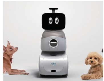
그림 4 Ogmen 로보틱스, Oro