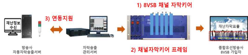
< 8VSB 재난방송 송출 체계 중 납품·설치 사항 >