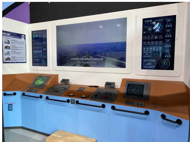
▲ 전파체험관의 '전파야 구해줘' 전시품